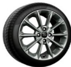
Štandardné 17" disky Vignale