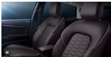
Vignale prémiové celokožené čalúnenie - koža Hexagon / Windsor s šesťuholníkovým vzorom