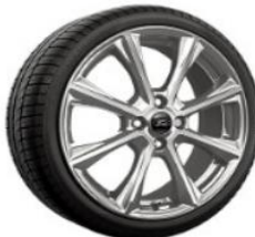
Prémiové 18" disky Vignale D2UA8